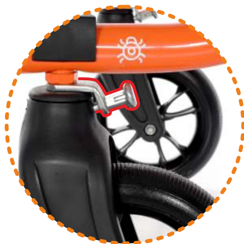
blokada kierunku jazdy