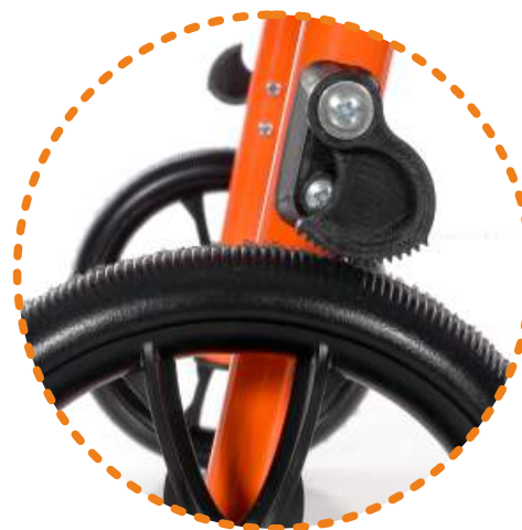
zabezpieczenie przed niekontrolowanym cofaniem