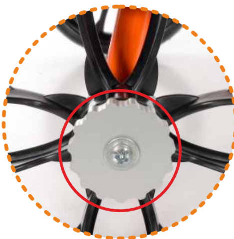
spowalniacz koła tylnego