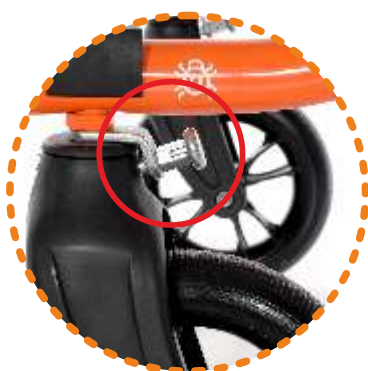
blokada kierunku jazdy