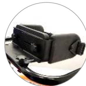
zestaw pelot biodrowych