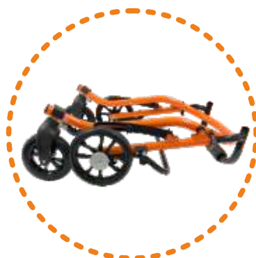
kompaktowy i praktyczny