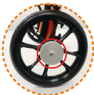
spowalniacz koła tylnego