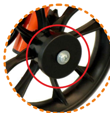
spowalniacz koła tylnego