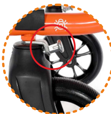
blokada kierunku jazdy