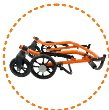
kompaktowy i praktyczny