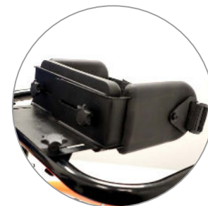
zestaw pelot biodrowych